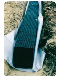
Przykładowa instalacja obejmująca jeden rząd modułów AquaBlok®