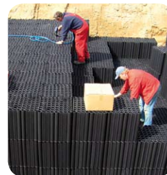
Przykładowa instalacja obejmująca kilka warstw modułów AquaBlok®

polega na ułożeniu w przygotowanym uprzednio wykopie półprzepuszczalnej geowłókniny, a następnie na umieszczeniu na niej, w zależności od parametrów gruntu (przepuszczalny, półprzepuszczalny lub nieprzepuszczalny) oraz ilości dopływającej wody deszczowej (w zależności od wielkości dachu i lokalizacji geograficznej obiektu) odpowiedniej ilości bloków (w poziomie lub w pionie). Po ułożeniu odpowiedniej ilości AquaBlok-ów, całość owija się geowłókniną. Tak wykonana instalacja zostaje zasypana gruntem.