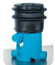
Filtr zbierający VF 1