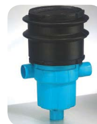
Filtr zbierający Garden